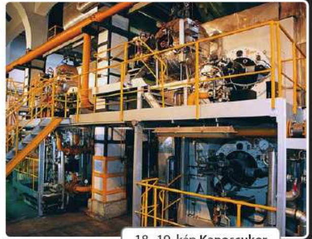
18., 19. kép Kaposucukor