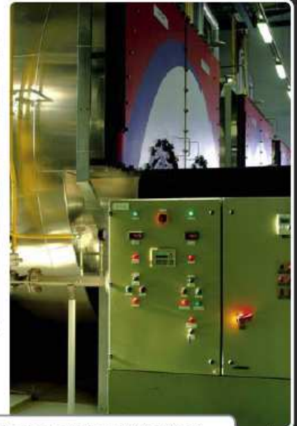
22., 23., 24. kép Kazincbarcikai Fűtőerőmű