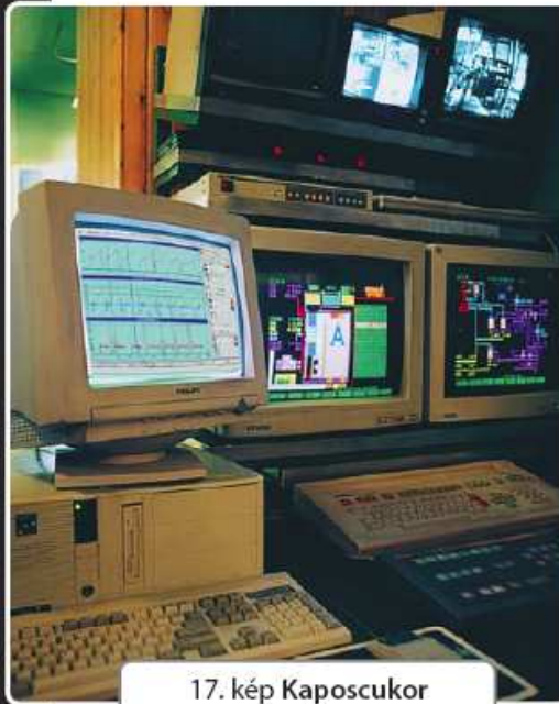
17. kép Kaposucukor

Design and implementation of the complete boiler-room process control system and the entire reconstruction of the lime-kiln process control system.