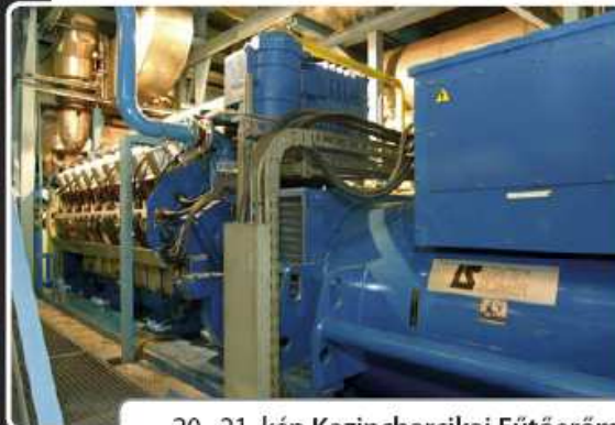
20., 21. kép Kazincbarcikai Fűtőerőmű

3 (2) db. Gázmotor, 3db. Forróvízkazán komplett vízkezelés, városi keringetés teljes Irányítástechnikai tervezése, kivitelezése. Városi Primer rendszer végponti és söntáji helyszíneinek aktív távmonitoringja.